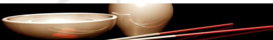
表 喪 夕 曲

Tel. 0543-712608/712601 biblioteca-saffi@comune.forli.fc.it