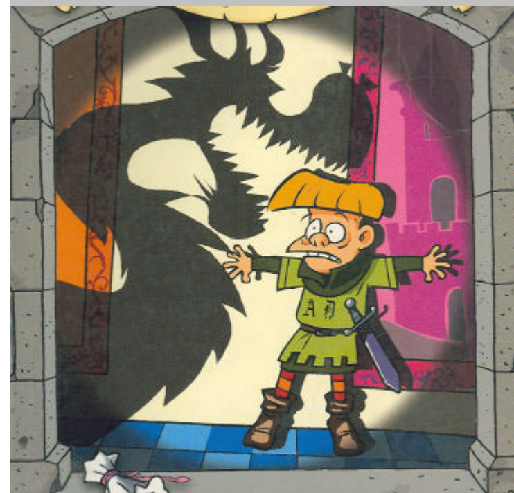
Illustrazione di Simone Frasca tratta dal libro Lezione n. 4: drago che abbaia non morde di K.H. McMullan, Piemme Junior 2003

Biblioteca comunale "Luigi Dal Pane" sala lettura dal 4 al 31 ottobre 2008